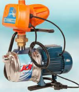
Isku-Jet vesipumppu Hinta alk. 265 €