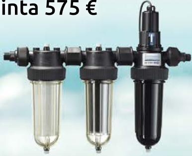
Watman Trio-UV Hinta 575 €