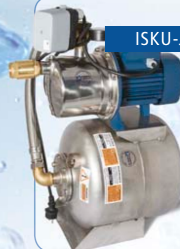
ISKU-Jet 1/25 RP