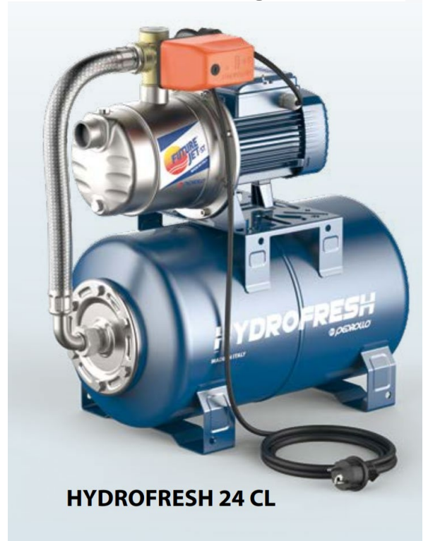
HYDROFRESH 24 CL